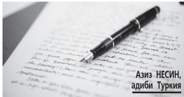
Азиз НЕСИН, адиби Туркия